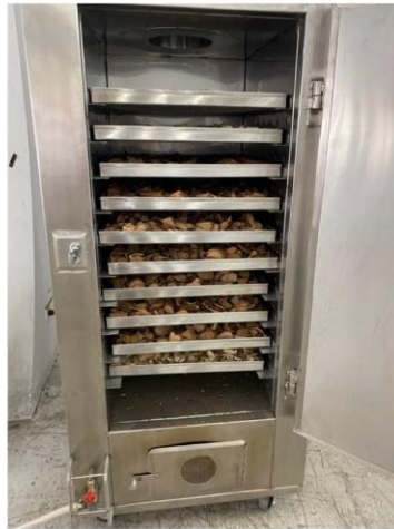
FB: แพทย์แผนไทยstyleหมอน้ำหวาน สนใจเรียนเสริม Line : @sookjaithailand