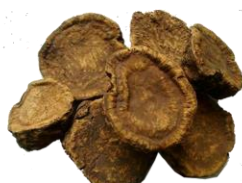
หนักสี่งละ ๒๒ ส่วน