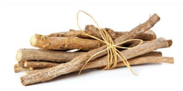
หนักสี่งละ ๑ ส่วน