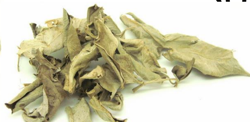
รูปถ่าย พ.3 ครูเจี๊ยบ