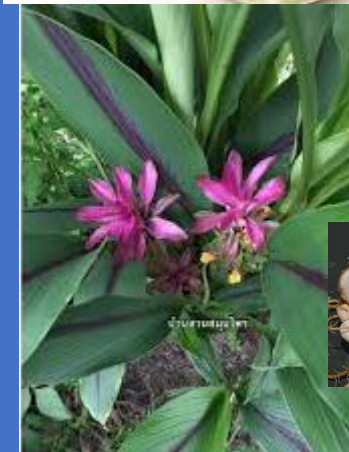
ไม้ล้มลุกลงหัว