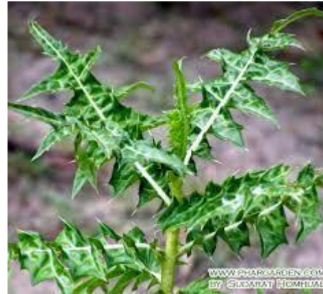
ใบเห็งือกปลาหมอ