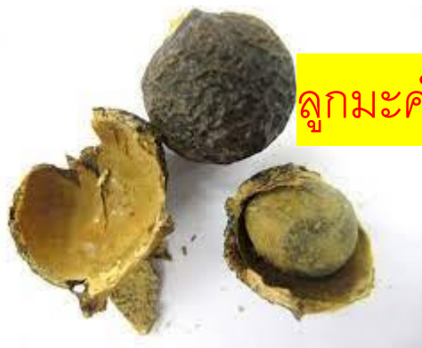
ลูกมะค้ำดีควาย