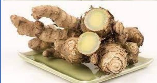
ว่านมหาเมฆ