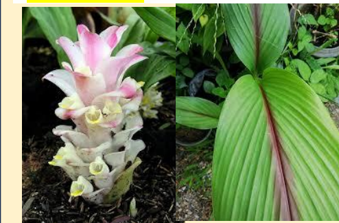
ไม้ล้มลุกลงหัว