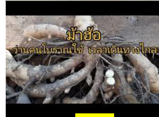
ว่านม้าฮ้อ

รารกรสมนไพร โทร 0629246459 ID line : herbsdtd