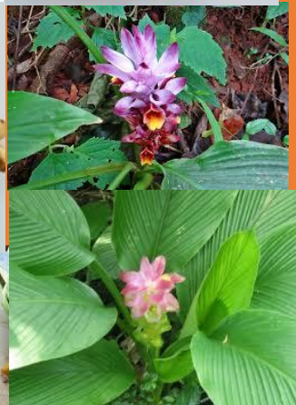
ว่านนางค้ำ