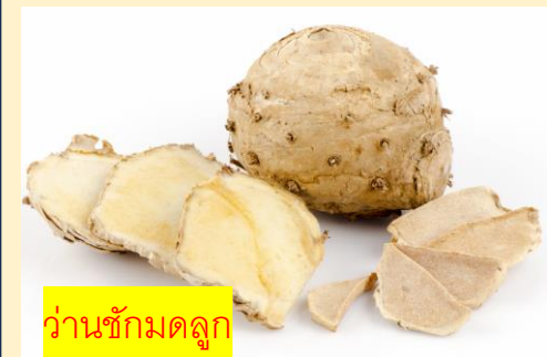
ว่านชักมดลูก