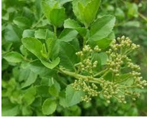
พืชจำพวก หญ้า (หนาดวัว)